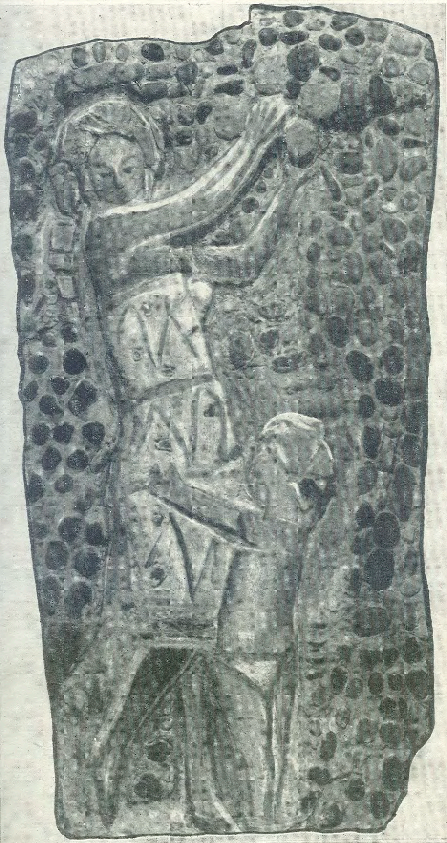
Б. Чернышов. Осень. Рельеф. Мозаика, фреска. 1963.