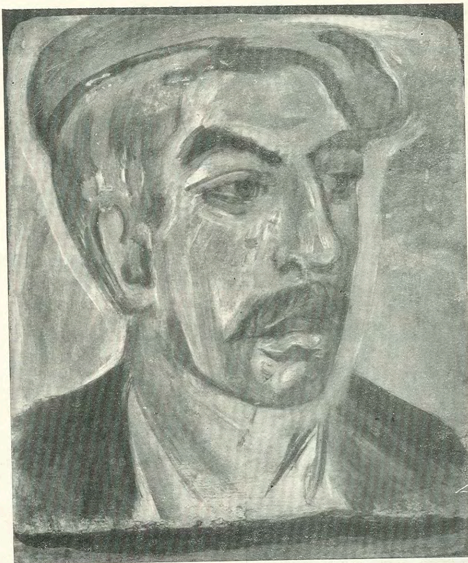
Б. Чернышов. Портрет рабочего. Фреска. 1962.

Поверхность сохраняет прикосновение руки художника, а не равнодушного исполнителя. Такие живые, пульсирующие поверхности могли бы быть особенно выразительны в сочета-